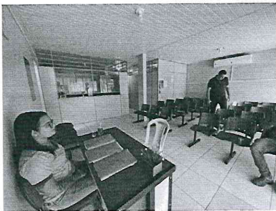
SALÃO PAV TERREO