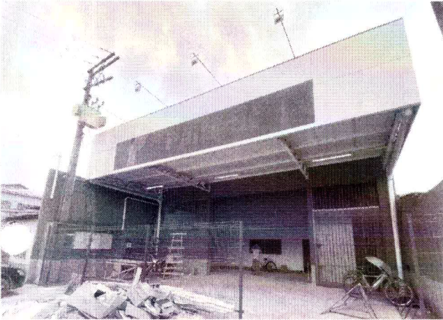
FRENTE DO GALPÃO