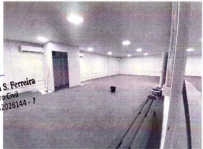
ÁREA INTERNA DO GALPÃO