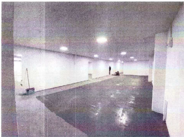
ÁREA INTERNA DO GALPÃO