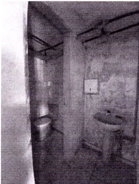
Autor: Sandy Barbosa