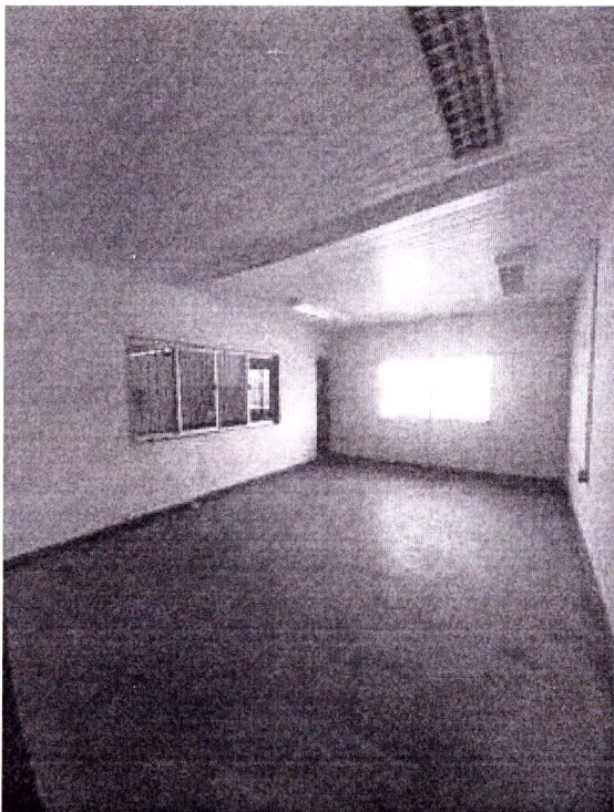
Autor: Sandy Barbosa