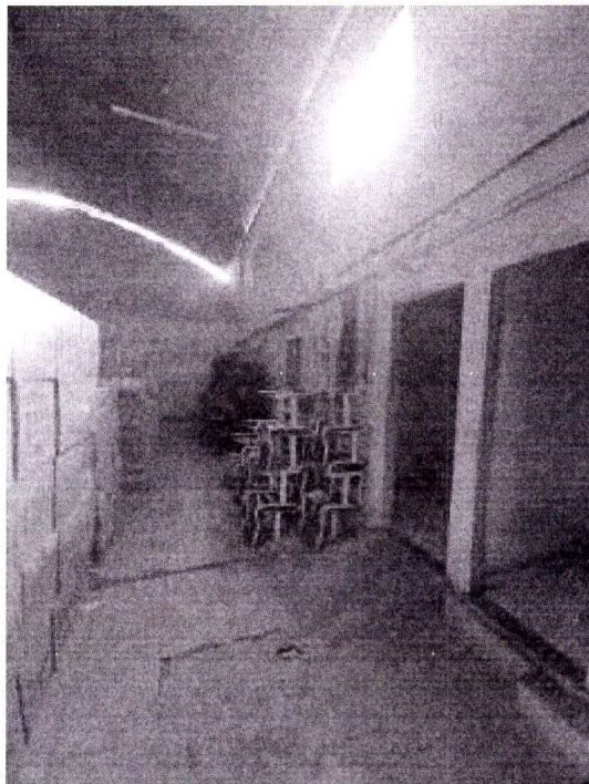
Autor: Sandy Barbosa