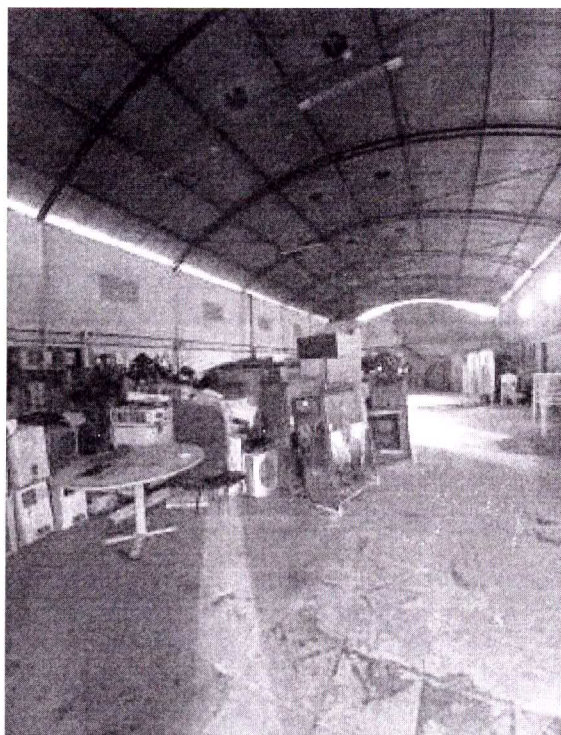
Autor: Sandy Barbosa