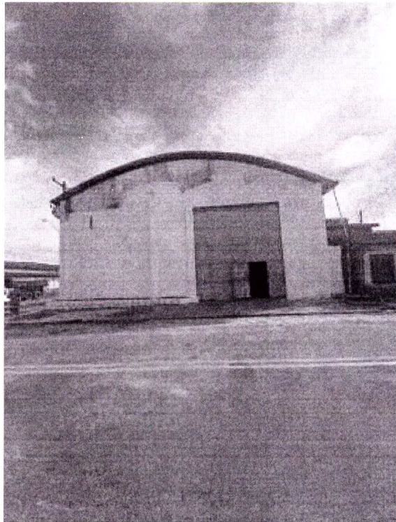
Autor: Sandy Barbosa